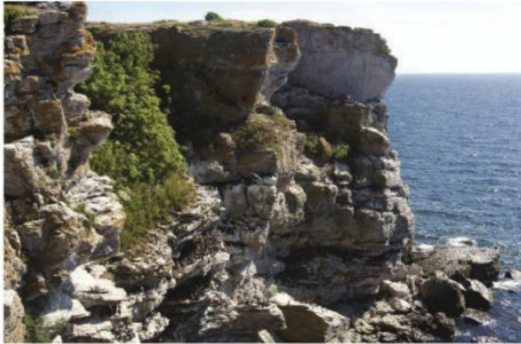
De branta klipporna på Stora Karlsö för tankarna utomlands. Härifrån kastar sig sillgrisslorna ut i havet.